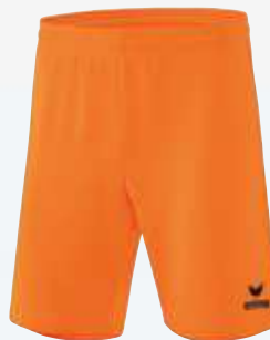
3151802 orange fluo