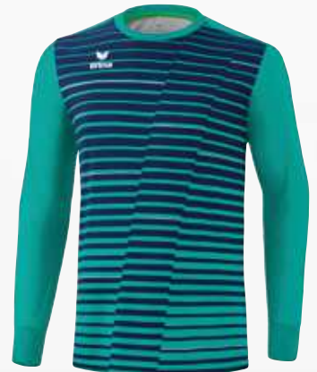
4142203 columbia/new navy