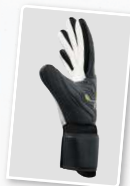
7222201 noir/jaune fluo

3 - 7,5 en demi-tailles, 8 - 10 en tailles complètes EUR 17,-*