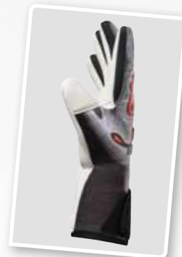
7222205 fiery-coral /noir