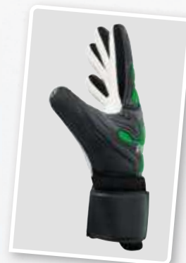
7222202 noir /green gecko

3 - 7,5 en demi-tailles, 8 - 10 en tailles complètes EUR 29,-*