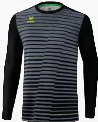
4142201 noir/slate grey