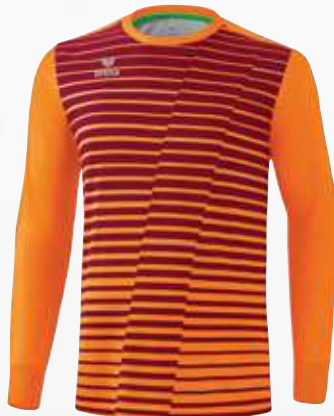
4142202 orange fluo/bordeaux